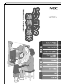
表紙はお使いのパソコンによって多少異なることがあります。

セットアップ前に『パソコンの準備と基本』に記載されている機器以外を接続したり、セットアップ中に電源を切ったり、不適切なユーザー名を入力してしまうなどして、 記載通りにセットアップしないと、正常にセットアップが完了しないだけでなく、故障につながる可能性があります。初めて電源を入れるときは、必ず添付のマニュアルをご覧ください。